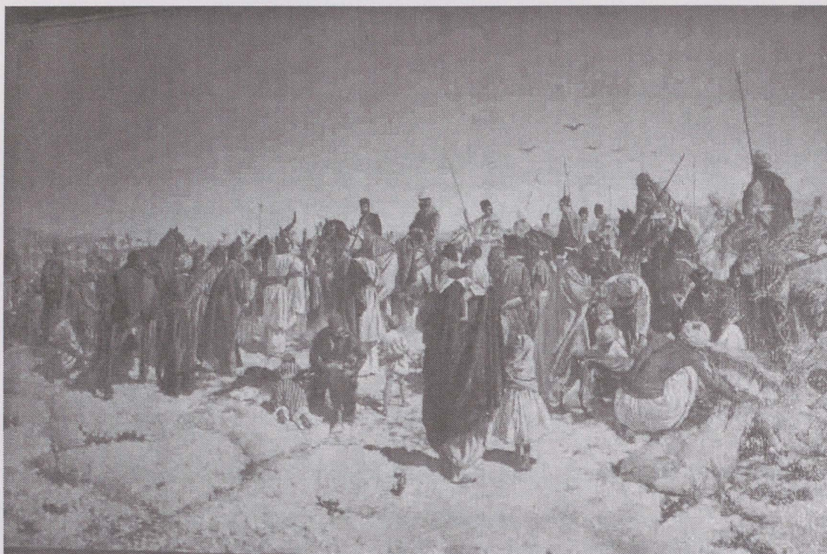
Fig. 1. Llegada a Dizful del Gobernador del Archirristan y del Vicecónsul de España.