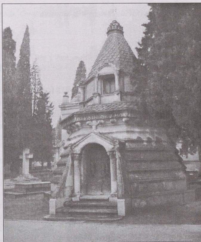
Fig. 3. Mausoleo de la familia Rivadeneyra